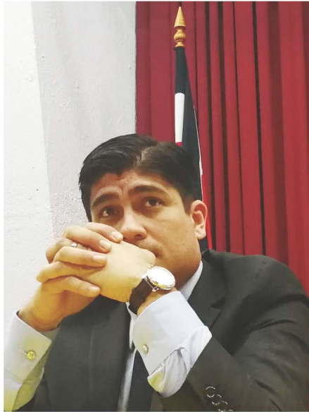
Carlos Alvarado Quesada (PAC).

Tiene una importante generación de empleo distribuida; participación importante de la alianza de lo público y lo privado, para fomentar ese crecimiento.