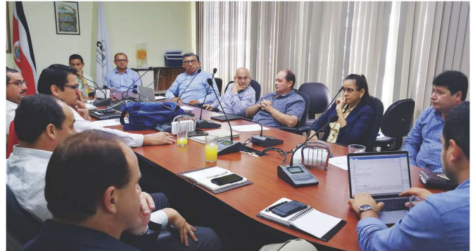
Asamblea de Agroindustriales de Conarroz.

Las funciones de la AA, son: Además de escoger a su directorio, elegir a los 13 representantes y suplentes, a la Asamblea General; y a 4 de sus miembros ante la Junta Directiva de Conarroz, así como conocer de los asuntos propios del quehacer de los agroindustriales de arroz y decidir sobre ellos.