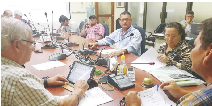
Asamblea Nacional de Productores de Conarroz.