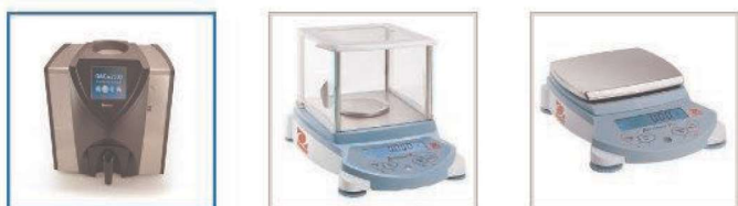
Equipo de Medición

Con la implementación de dicho sistema, por ejemplo, los analistas colocan las muestras de arroz en las respectivas balanzas y el resultado obtenido es almacenado inmediatamente por el software. Se elimina de esta manera, el posible error que se puede presentar al momento de hacer la transferencia de datos a los registros y, además de los registros, a