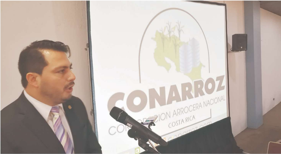
Carlos Mora, viceministro del Meic: "Somos conscientes del impacto que tiene el sector productor arrocero en cada uno de los territorios rurales de nuestro país, trayendo empleo, beneficio, a cada una de las poblaciones de las áreas rurales".

El sector arrocero genera empleo en los territorios rurales del país aseguró el viceministro de Economía, Industria y Comercio, Lic. Carlos Mora, durante su último encuentro en la reunión anual con productores e industriales del grano, donde hizo un llamado a prepararse ante los desafíos de la globalización.