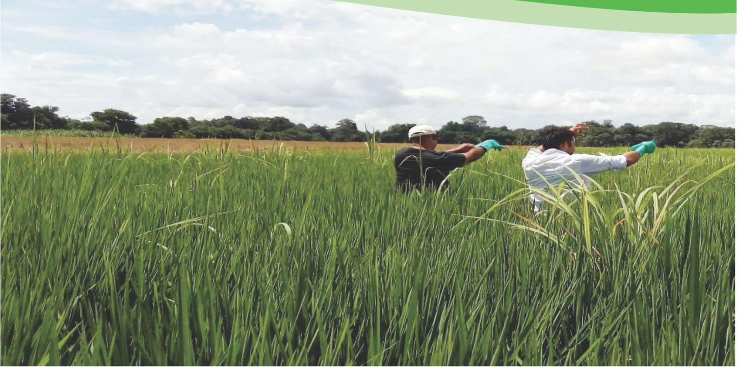
Productores arroceros de La Campiña de Corredores, durante una aplicación de la técnica del guante de goma, en la región Brunca.

Disminuir los grados de impurezas a la hora de la corta para optar por un mejor precio por calidad, es la finalidad de las capacitaciones sobre el control de escapes de malezas contaminantes, impartidas por la Corporación Arrocera Nacional (Conarroz), en las diversas regiones cultivadoras del grano.