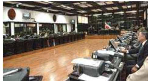
Los diputados aprobaron en segundo debate el convenio UPOV.

Sin embargo, la aprobación en segundo debate deja por fuera esta posibilidad, ya que ahora solo falta la sanción del Presidente de la República y la publicación del texto aprobado en La Gaceta, para que el convenio sea nueva ley.